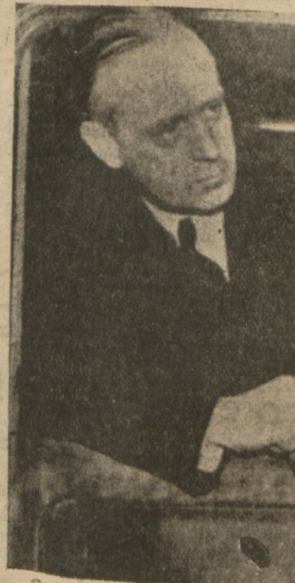
hariciye nazırı Ribbentrop

Harrarın düşmesi de büyük bir ehemmiyeti haizdir. Çünkü şimdî Adisababa ile Cibuti arasındaki son münakale hattı tehdit altındadır. Artık Habeşistanın işgali için isticale lüzum yoktur. Eritre muharebesinin neticesi ile büyük İngiliz kuvvetleri serbest kalacaktır.