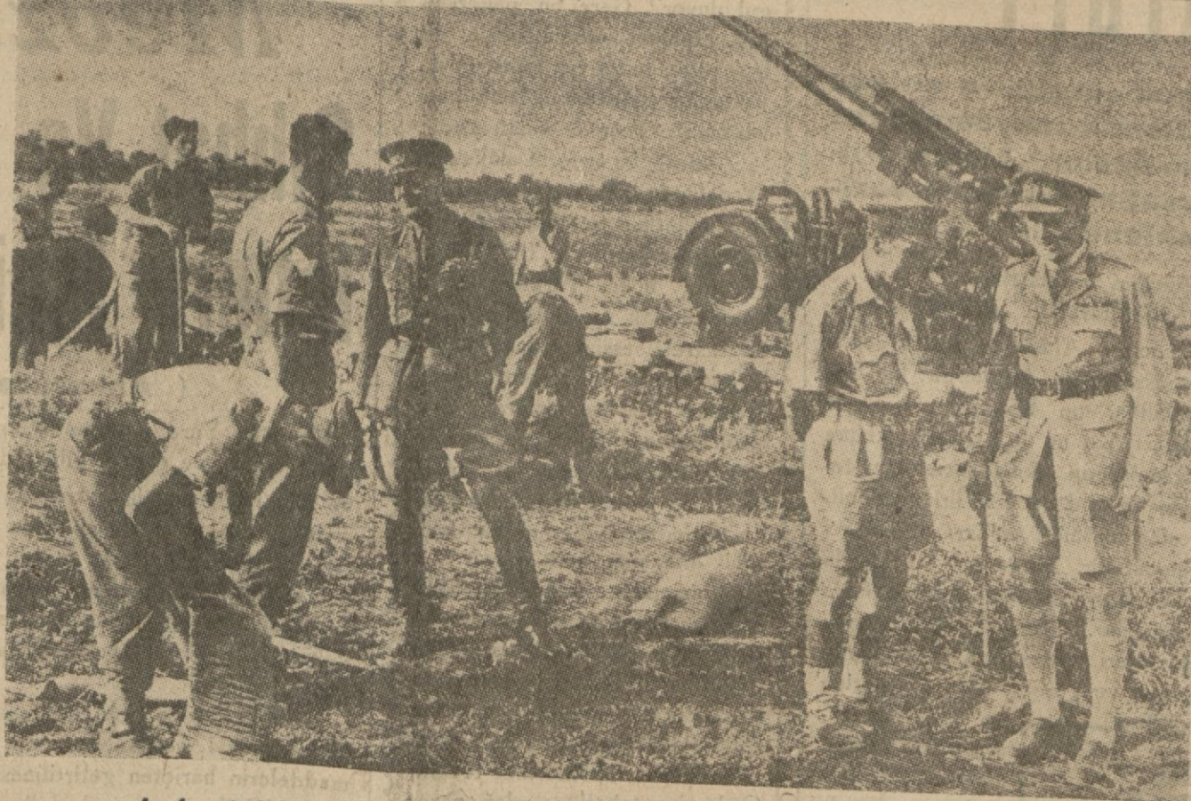
Afrika Harekâtında General Wegvel

Belgradta Almanlara karşı nümayişler yapılmaktadır. İsveçin Belgrad elçisi Almanca konuştuğu için dövülmüştür.